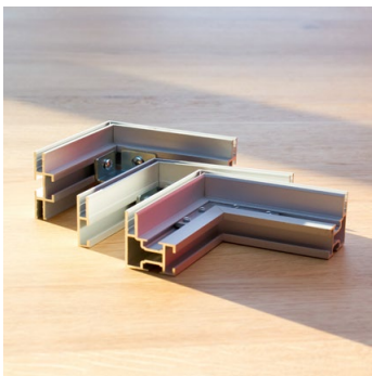
verschiedene Profile für unterschiedliche Rahmen-Tiefen stehen zur Auswahl

Elegant, unauffällig und extrem hochwertig!