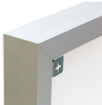
in den Rahmen integrierte Aufhängehaken zur einfachen Wandmontage