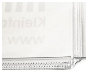
an den Stoff angenähter, transparenter Gummiflach-keder